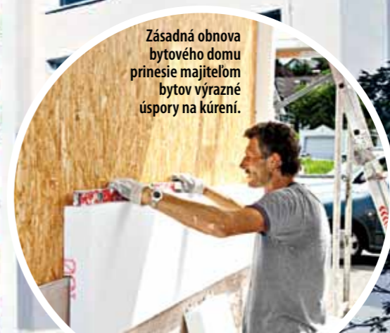
Zásadná obnova bytového domu prinesie majiteľom bytov výrazné úspory na kúrení.