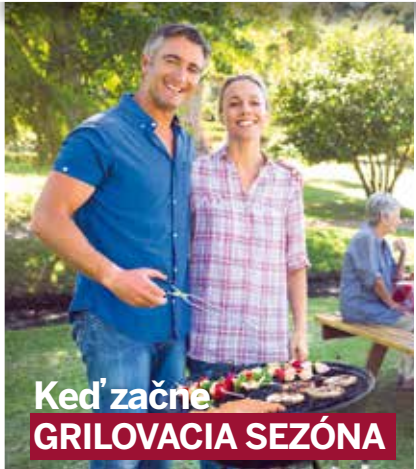
Keď začne GRILOVACIA SEZÓNA