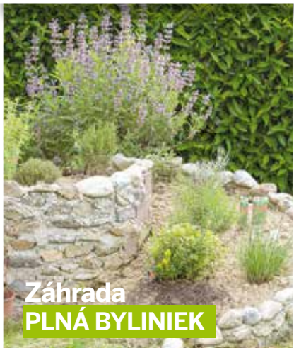
Záhrada PLNÁ BYLINIEK