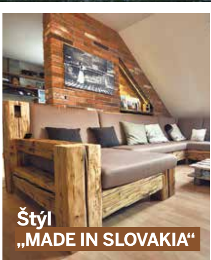
Štýl „MADE IN SLOVAKIA“